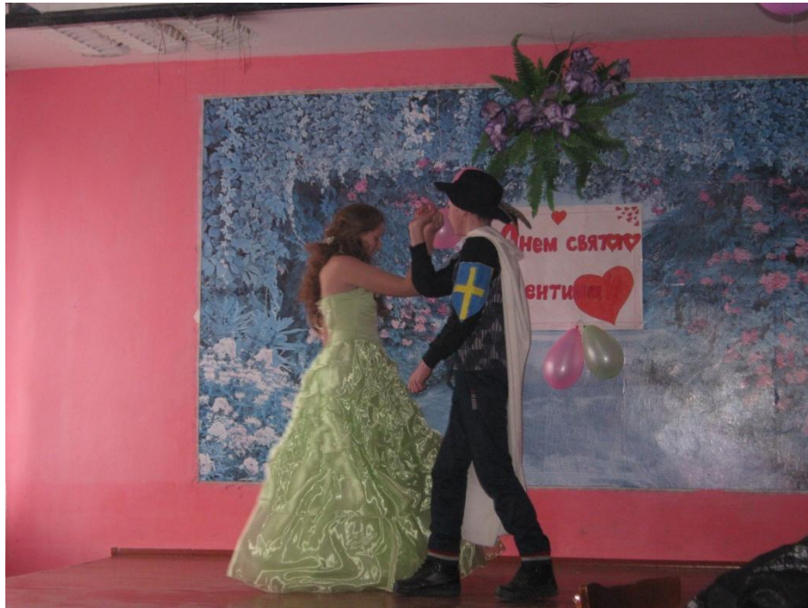
«Романтичний танець у виконанні Генріха I і Анни Ярославни»