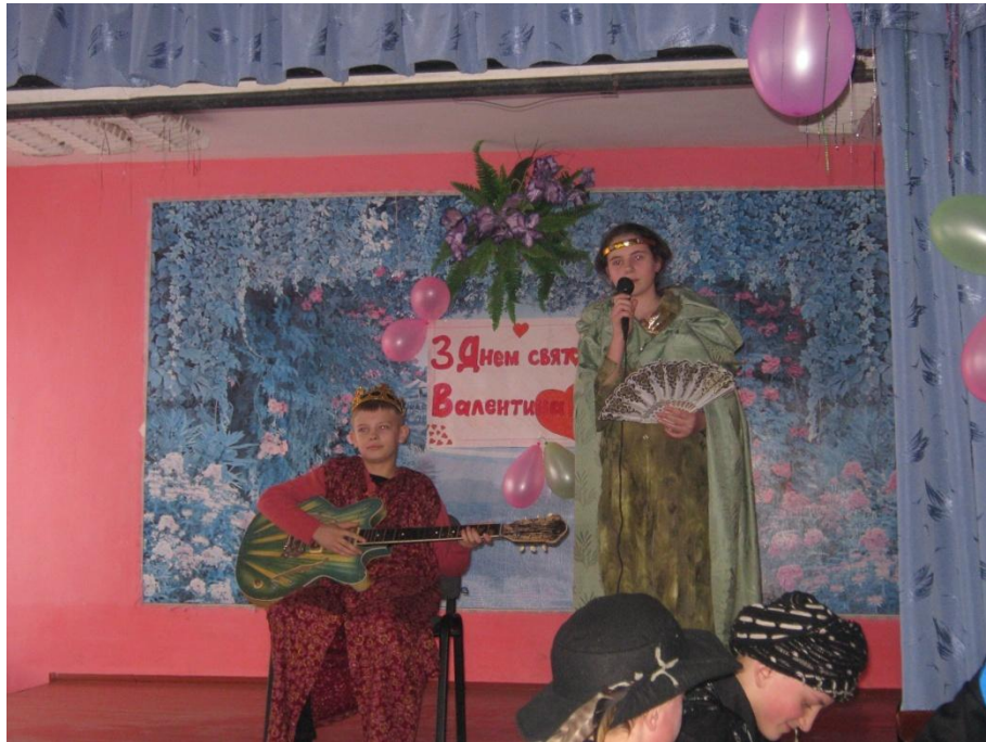
«Співають Фердинанд і Ізабелла»