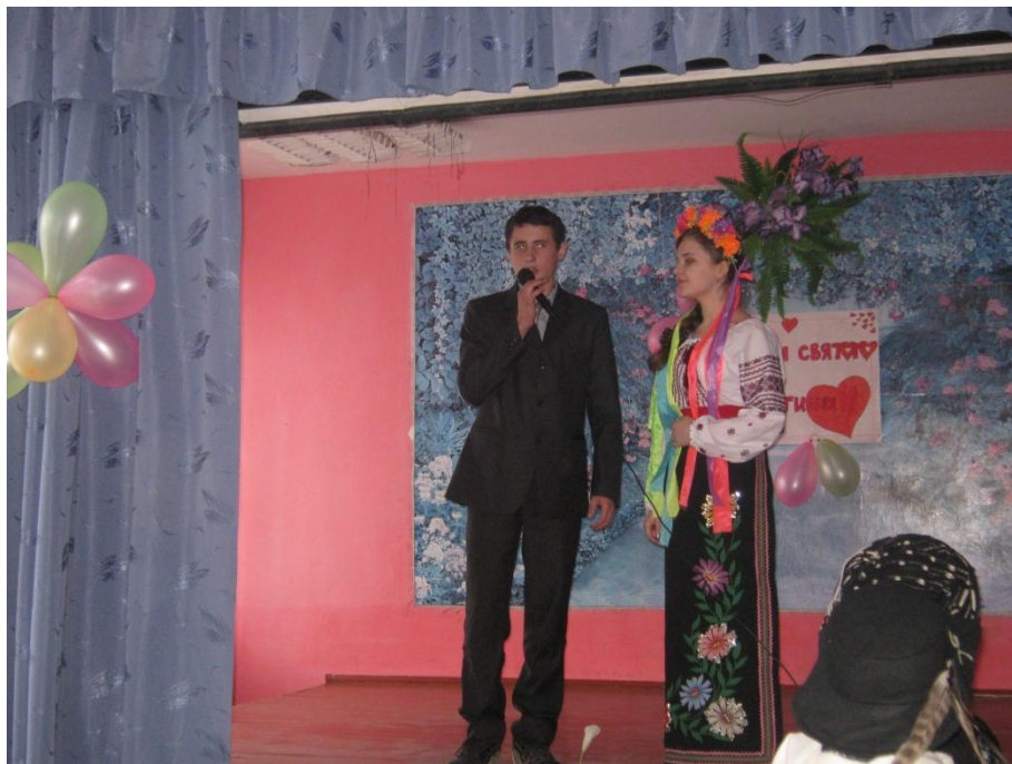
«Розмова Лесі Українки і Сергія Мержинського»