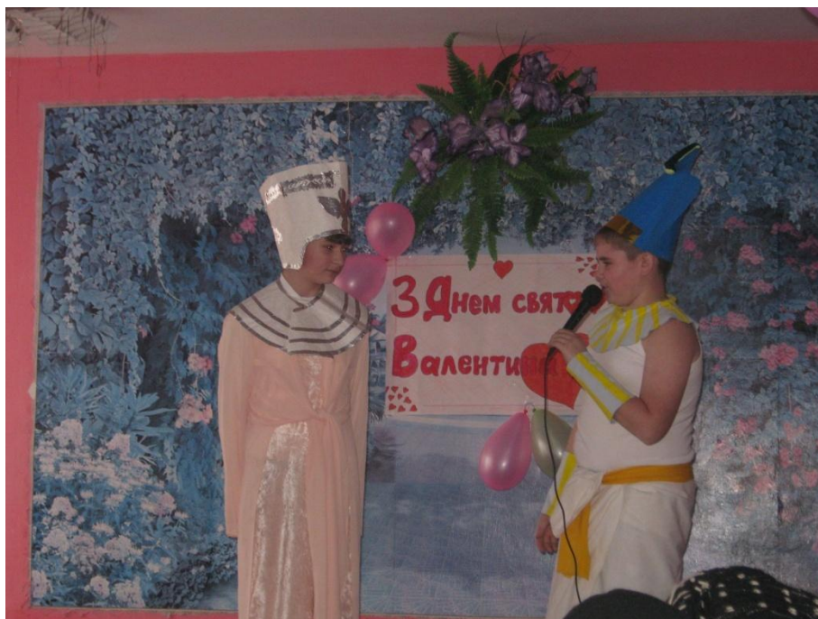
«Ехнатон і Нефертітті читають вірші»